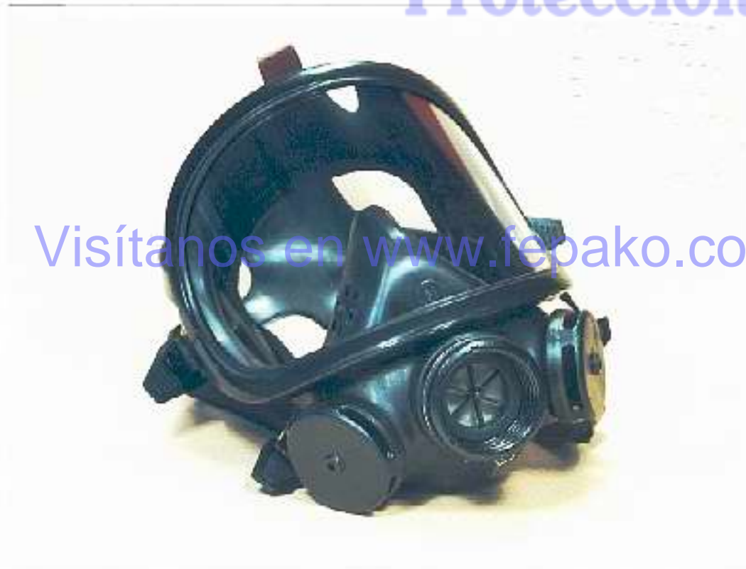
Photographie de l'équipement