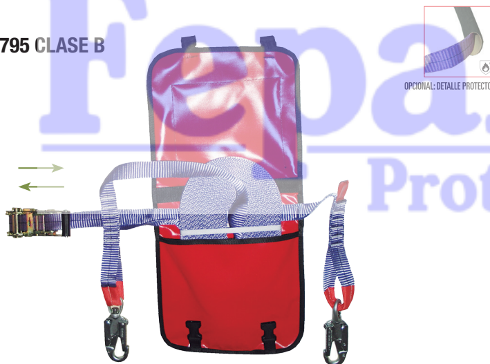
OPCIONAL: DETALLE PROTECTOR